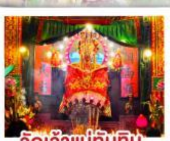
วัดเจ้าแม่ทับทิม