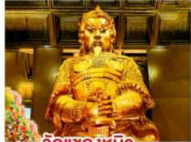
วัดแชกงหมิว