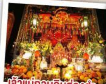
เจ้าแม่กวนอิมฮ่องกง