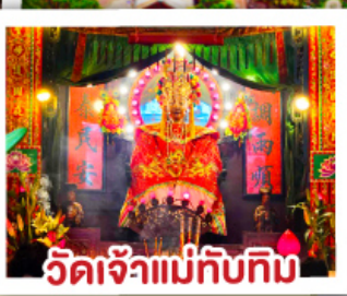
วัดเจ้าแม่ทับทิม