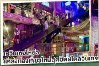
เทวีนหอไหย่อ แหล่งท่องเที่ยวใหม่สุดฮิตสไตล์ลูนเทจ