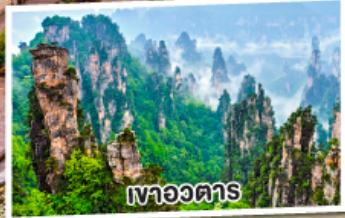
เหวอวตาร