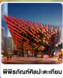
พิพิธภัณฑ์ศิลปะตะเกียบ