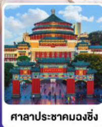
ศาลาประชาคมฉงชิ่ง