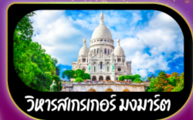
วิหารสกรเกอร์ มงมาร์ต