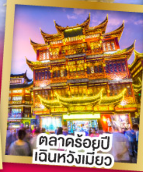
ตลาดร้อยปี เงินหวังเมี่ยว