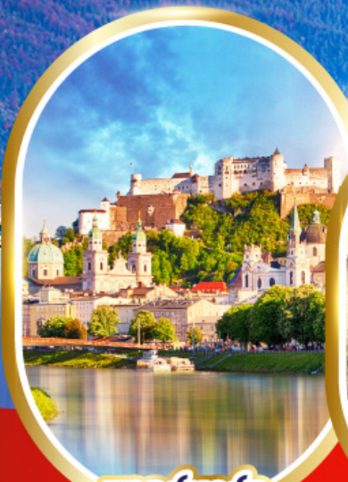
ซาลส์บวร์ก