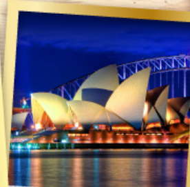
ซิดนีย์โอเปร่า