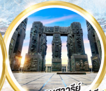
อนสาวรีย์ ประวัติศาสตร์จอร์เจีย