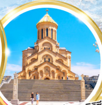
วิหารศักดิ์สิทธิ์ของทบิลีซี