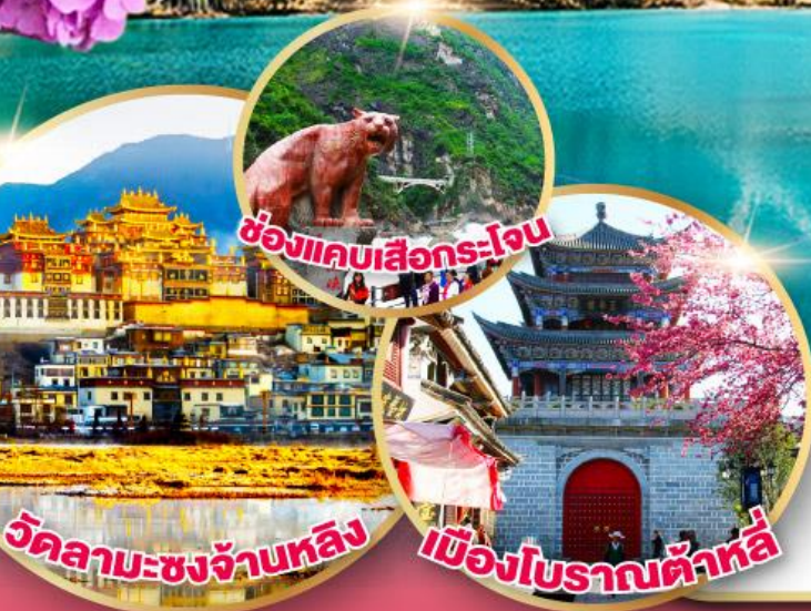
ชื่องานเลือกกระโจน