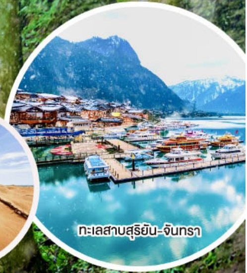
ทะเลสาบสุริยอัน-จินทรา