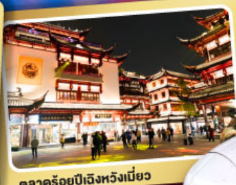
ตลาดร้อยปีเฉิงเหมียว