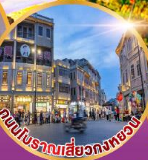
ถนนโบราณเสี่ยวกงหยวน