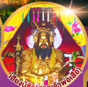
เอ็งบูซิว (ศาลเจ้าพ่อเสือ)

เมนูพิเศษ!! อาหารแต่จิว 18 อย่าง ผ่านพะไลต้นตำรับชัวเถา สุกี้ซิวผัด