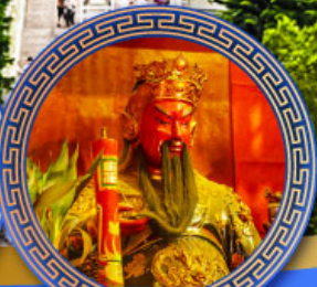
วัดกวนไท่