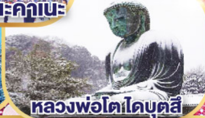
หลวงพ้อโตโดบตล