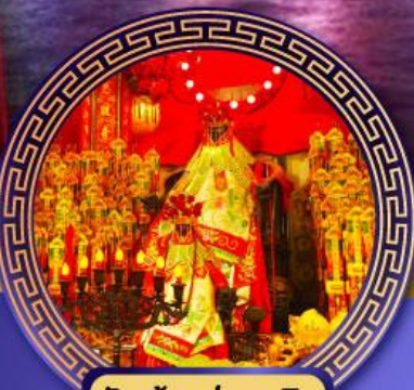
วัดเจ้าแม่กวนอิม ฮ่องกง