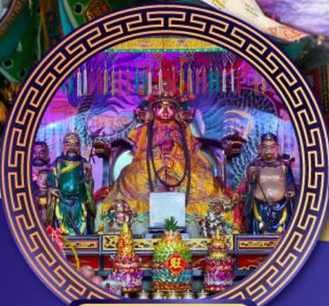
ศาลเจ้าหังเจีย