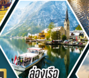
ล่องเรือ ทะเลสาบอัลสติก