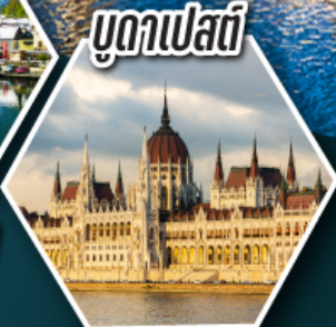
บูดาเปสต์