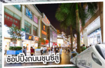
ช้อปปิ้งถนนชุนซีลู่