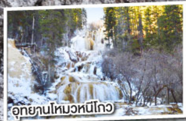
อุทยานโหมวหนีโกว