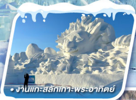
• งานแกะสลักเทวพระอาทิตย์

ชมดอกเกล็ดหิมะ อู๋ซัง ทัศนียภาพอัศจรรย์แห่งทะเลสาบกระจก จิ่งป้อหู