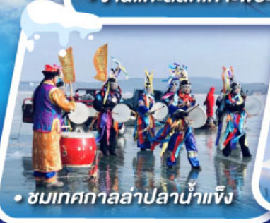
• ชมเทศกาลล่าปลาน้ำแข็ง

งานเทศกาลแกะสลักหิมะที่ใหญ่ที่สุดในโลก HARBIN ICE & SNOW FESTIVAL 2025 เที่ยวหมู่บ้านหิมะ ดินแดนหิมะอันสุดประทับใจ