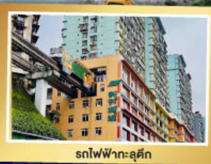
รถไฟฟ้า-ลูตึก