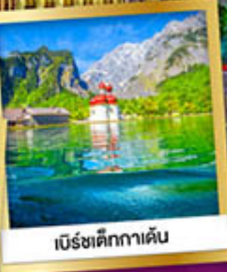
เบ็รชตีคกาเดิน