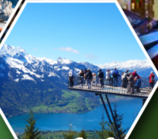
ยอดเขาอาร์ดอร์คคุม

พักเมืองเซอร์แมท เมืองตากอากาศระดับโลก ที่มีฉากหลังเป็นยอดเขามัตเตอร์ฮอร์น ราคาเริ่มต้น