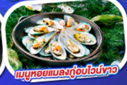
เมนูหอยแมลงภู่อบไวน์ขาว