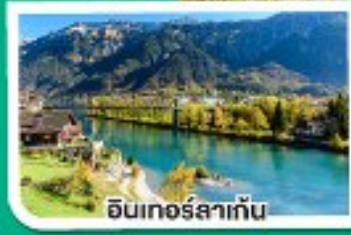
อินทอร์สไก่น