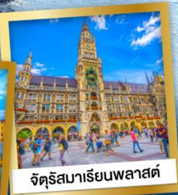
จัตุรัสมาเรียนพลาสต์

28 ธ.ค.67-05 ม.ค.68 95,900 12-20 ก.พ., 12-20 มี.ค.68 89,900