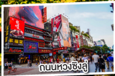
ถนนหลวงฉิงฉู่