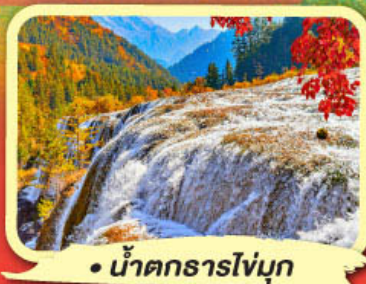
• น้ำตกธารไถ่มุก