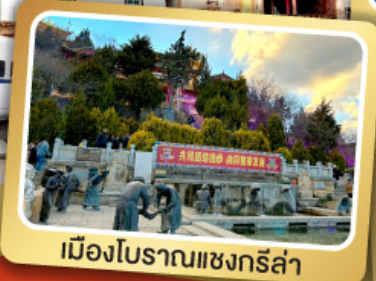
เมืองโบราณแชนกรีล่า