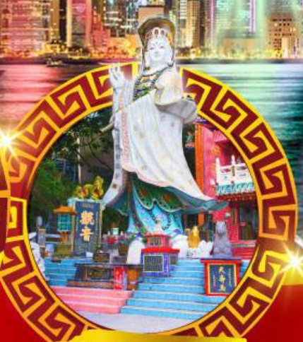
เจ้าแม่กวนอิม ทาครีฟส์ลีย์