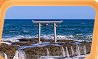
ศาลเจ้าโออาไรโอชิซาทิ

แพคเกจใกล้ชิด "ฟูจิซัง" ที่หมู่บ้านโอชิโนะ อักโท สวนโออิชิปาร์ค ที่เที่ยว Unseen นั่งกระเช้าชมวิวภูเขาสิคุยะ ศาลเจ้าโออาไรโอชิซาทิ ศาลโทริอิริมทะเล อลังการโบสถ์เปลี่ยนสี น้ำตกเคจอน ศาลเจ้านิกโกโทโชกุ เสรียมมงคล วัดพระใหญ่ซึคุ ไดบุคสี ห้ามพลาดโคมแดงยักษ์ วัดอาซากุสะ อิมอร้อยตลาดปลาโทโยสุ ภัตตาคารแนว 3D ย่านชิจูกุ ช้อปปิ้งย่านดังชิบูย่า