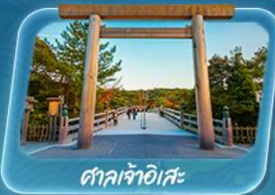
ศาลเจ้าอิเสะ

12 - 17 พ.ค. 69 / 19 - 24 พ.ค. 69 26 - 31 พ.ค. 69 / 2 - 7 มิ.ย. 69 9 - 14 มิ.ย. 69