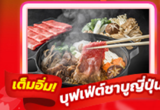
เต็มอิ่ม บุฟเฟ่ต์ชาบูญี่ปุ่น