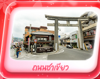
ถนนซาเซงว

Highlight ชมความงามหมู่บ้านมรดกโลก หมู่บ้านชิราคาวาโกะ เมืองเก่าทาคายามา ทะยานสู่ฟ้า กำแพงวิว Panorama ขึ้นกระเช้าลอยฟ้าโทโซโซ พลาดไม่ได้ ปราสาทโอซาก้า วัดเมียวโดอิน ถนนซาเซงว โอโมเตะเซนโด ช้อปปิ้งย่านชินโซบาชิ และ Outlet