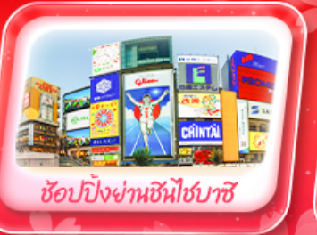
ช้อปปิ้งย่านชินโซบาชิ