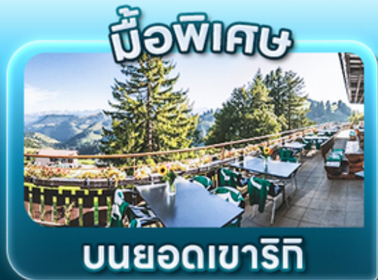
บิวพีเศษ