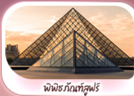
พิพธิภันท์ลูฟร์