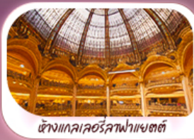
ต้างแกลแควอร์ราฟาแยตตี