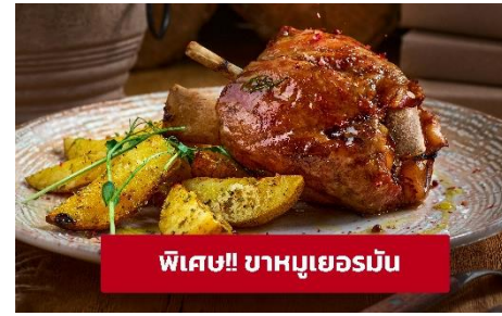
พิเศษ!! ขาหมูเยอรมัน

นำท่านเที่ยวชม เมืองฟูสเซน (Fussen) ขึ้นชื่อเรื่องความสวยงามของตัวตึก รามบ้านช่องเพราะทั้งเมืองจะมีหลากสีสันเหมือนกับลูกกวาดสีสวยๆ ทั้ง เมืองจนได้รับสมญานามว่า City of candy นำท่านเดินทางสู่ เมืองเคมป์เทิน (Kempten) (ระยะทาง 46 กม./ 1 ชั่วโมง) เป็นชุมชนเมืองที่เก่าแก่ที่สุดใน เยอรมนี ให้ท่านถ่ายรูปบริเวณด้านนอก มหาวิหารเซนต์ลอว์เรนซ์ แอชวิลล์ (Basilica of Saint Lawrence) สร้างเสร็จในปี 1909 และเป็นหนึ่งในสมบัติ ทางสถาปัตยกรรมและจุดยึดทางจิตวิญญาณของแอชวิลล์