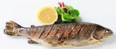
พิเศษ!! ปลาเทราต์ย่าง

เย็น ๑๐ รับประทานอาหารเย็น (มื้อที่4) ที่พัก : Gartenhotel Maria Theresia Hall หรือโรงแรมและเมืองระดับใกล้เคียงกัน (ชื่อโรงแรมที่ท่านพัก ทางบริษัทจะทำการแจ้งพร้อมใบนัดหมาย 5-7 วัน ก่อนวันเดินทาง)