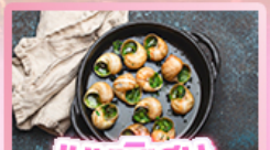
เมนูพิเศษ หอยเอสคาโท

เยอรมัน เนเธอร์แลนด์ เบลเยียม ฝรั่งเศส Keukenhof