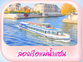
คองรีอแม่น้ำแซน