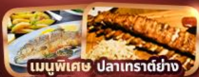
เมนูพิเศษ ปลาเทราต์ย่าง Ribs Of Vienna (1 rack 500g)