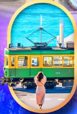
ถนนโคมาจิโคริ