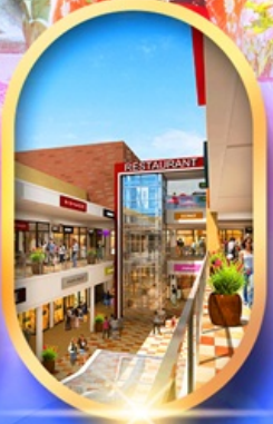
มิตซุชิเอ็งเกิ้ลิต