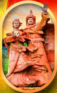
เมืองโบราณชงฟาน