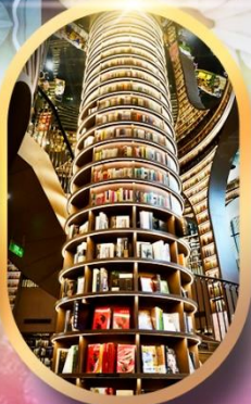
หอหนังสือจุงชูก่อ