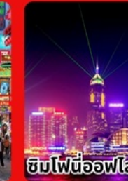
ชมไฟนีออนไฟท์

ราคาเที่ยวเที่ยวเกินคุ้ม 15,999 บาท/ท่าน