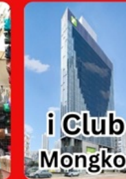
i Club Mongkok

คอนเฟิร์มเดินทาง พ.ย.67 1-3 / 8-10 / 15-17 / 22-24 พัก 4 ดาวย่านช้อปปิ้ง i CLUB MONGKOK