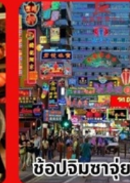
ช้อปปิ้งจิวเวลรี่