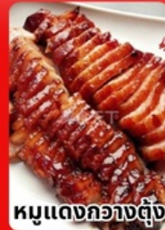
หมูแดงกวางตุ้ง