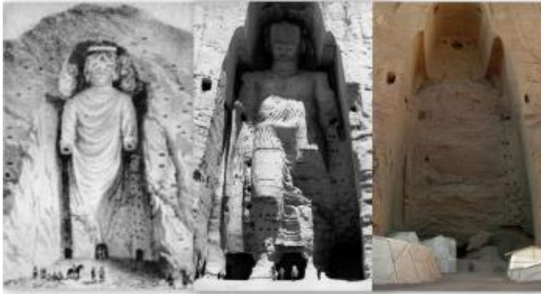
Drawing of the Buddha of Bamiyan by Alexander Burnes during his visit in 1832