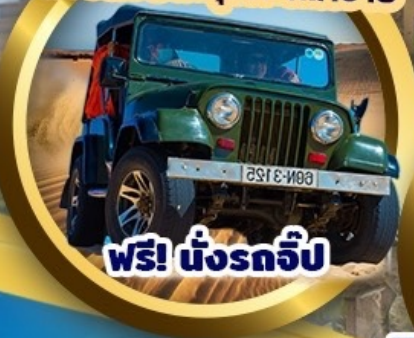
ฟรี! นั่งรถจี๊ป