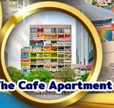
The Cafe Apartment