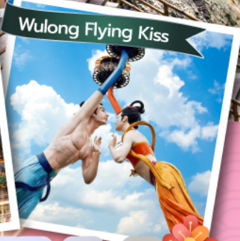
Wulong Flying Kiss