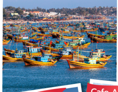
หมู่บ้านชาวประมงมุยเน่