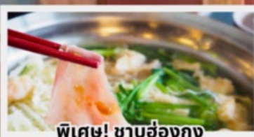
พิเศษ! ซาบูฮ่องกง