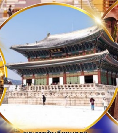
พระราชวังเคียงบกกุง