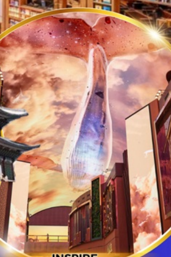
INSPIRE Entertainment Resort

ใหม่!! ห้องสมุดสุดอลังการที่ชวอน ชมจอ LED เสมือนจริงขนาดยักษ์ สนุกสุดมันส์ที่สวนสนุกเอเวอร์แลนด์ ชมพระราชวังเคียงบกกุง ถนนวัฒนธรรมอินชาง อิสระช้อปปิ้งคังนัม เมียงดง Lotte Duty Free