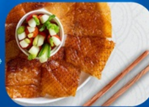
พิเศษ!! เมนูเปิดปักกิ่ง