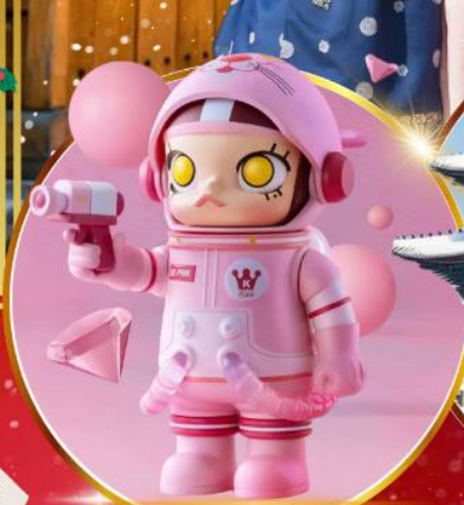
POP MART ฮงแด