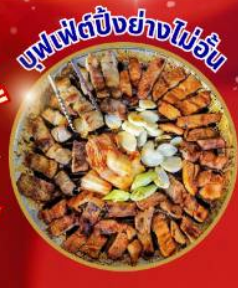
บุฟเฟ่ต์ปิ้งย่างไม่วัน