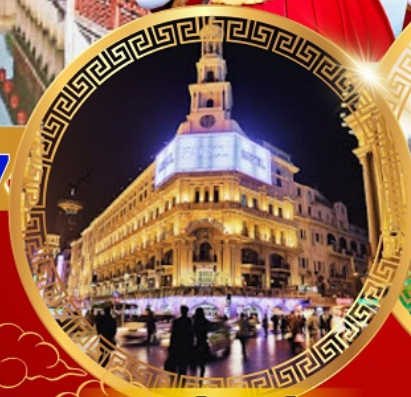
ถนนคนเดินหนานจิง

เดอะบอนด์ หาดไต้หวัน ขึ้นหอไข่มุก อิสระ เชียงใหม่ ดิสนีย์แลนด์ วัดหลงหัว อายุมากกว่า 1700 ปี สักการะวัดพระหยกขาว สวนอีหวนกว่า 400 ปี สตาร์บัค ใหญ่ที่สุดในเอเชีย ช้อปปิ้งถนนโบราณชื่อดัง