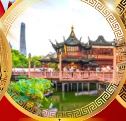
สวนอีหวน