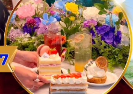
คาเฟ่ดัง Forest Outing